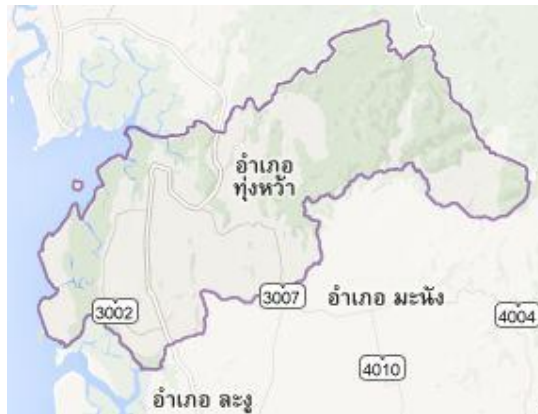
แผนที่อำเภอทุ่งหว้า

อำเภอทุ่งหว้ามียี่พื้นที่โดยประมาณ ๖๗๒,๖๒๘ ตารางกิโลเมตร มีลักษณะเป็นที่ราบสูงและภูเขา และลาดลงไปทางทิศตะวันตกเป็นชายฝั่งป่าชายเลน ทิศเหนือติดต่อกับอำเภอปะเหลียนจังหวัดตรัง ทิศใต้ติดต่อกับอำเภอละงู จังหวัดสตูล ทิศตะวันออกติดต่อกับอำเภอควนกาหลง จังหวัดสตูล,อำเภอตะโหมด จังหวัดพัทลุง และอำเภอรัตนภูมิ จังหวัดสงขลา ทิศตะวันตกติดต่อกับทะเลอันดามัน มหาสมุทรอินเดียอยู่ห่างจากอำเภอเมืองสตูล ๗๕ กิโลเมตร ประกอบด้วย ๕ ตำบล ๓๕ หมู่บ้าน ได้แก่ตำบลทุ่งหว้า ๑๐ หมู่บ้าน,ตำบลนาทอน ๙ หมู่บ้าน,ตำบลทุ่งบุหลัง ๕ หมู่บ้าน,ตำบลป่าแก่บ่อหิน ๗ หมู่บ้านและตำบลชอนคลาน ๔ หมู่บ้าน