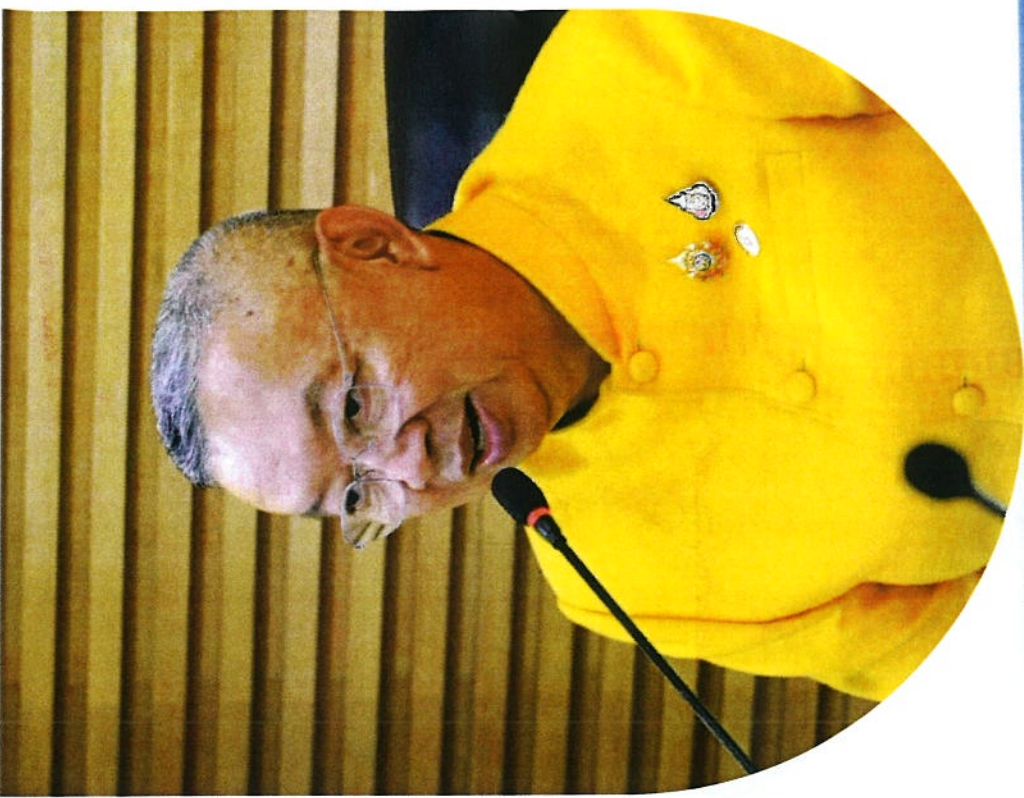
พลตำรวจเอก เพิ่มพูน ชิดชอบ